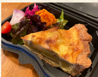
農園野菜キッシュ