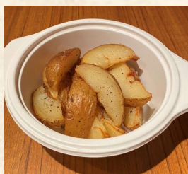
農園じゃがいも ポテトフライ

当日のご購入も可能ですが、ご注文いただいてからお作りしますので、ご予約いただけますと、お待たせせずに、お渡し出来ます◎ その他メニューにつきましても、お気軽にご相談ください!!