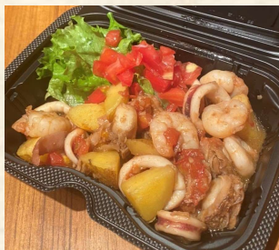
シーフードおろしバルサミコソテー