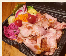
ビストロ風ポークソテー ~おろしバルサミコBBQソース