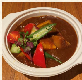
アンガスビーフシチュー