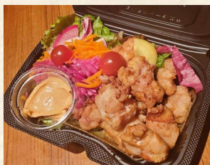
ビストロ風とりから